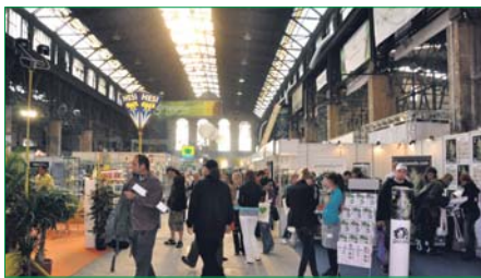
Cannabizz 2010

C'est au cœur de l'Europe, dans l'une de ses plus belles capitales où de nouvelles lois libérales sont en vigueur, à Prague, qu'il faut aller pour pouvoir dire « j'y étais ». Vous pourrez entrer en contact directement avec les meilleurs spécialistes et connaisseurs de la planète cannabis, vous pourrez être informé des dernières évolutions technologiques de la culture intérieure, sur les produits issus du chanvre sous toutes ses formes et très à propos, sur l'évolution des lois au sein de l'Union européenne.